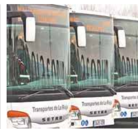
Imagen del Metropolitano.