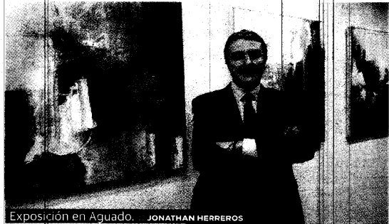
Exposición en Aguado. JONATHAN HERREROS

ARTE LA RIOJA. Ayer, a las 20 horas, se inauguró la nueva exposición de Aguado en la galería de arte sita en la calle San Antón, 12 de Logroño. La muestra lleva por título 'Sensaciones & diálogos' y en ella el autor riojano explora el camino ya anunciado en sus últimos trabajos más alejados del figurativismo y más cercanos a la investigación pictórica.