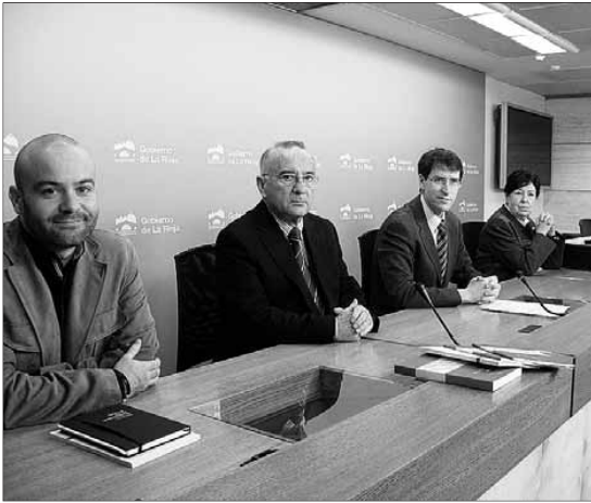
El consejero de Cultura y miembros de Cilengua y del CSIC, en la presentación.