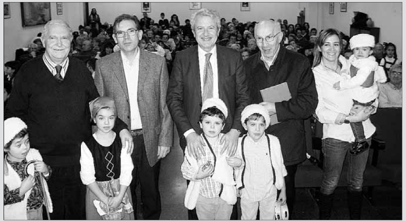
El consejero de Presidencia (tercero por la izquierda), con miembros del centro y de Aulas de la Tercera Edad. /NR

► Las biblias judeorromances y el Cantar de los Cantares. Estudio y edición. Sergio Fernández López: Dentro de la sección bíblica que en el canon judío se denomina 'Escritos', destaca uno de los más singulares y controvertidos libros de las Sagradas Escrituras: se trata del Cantar de los Cantares . Desde muy pronto, aquella especificidad dentro de las Escrituras se tornó un asunto problemático. Por eso no tardaron en surgir, ya desde época rabínica, voces discordantes que discutieron su auténtica condición de libro sagrado e incluso su apropiada introducción en el canon bíblico.